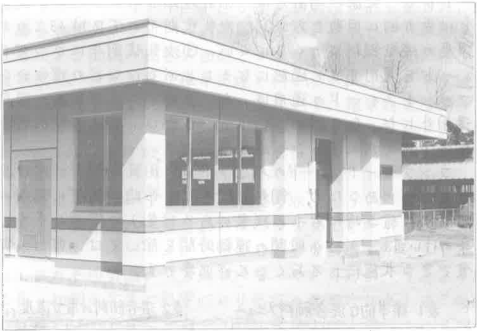
完成した受精卵研修棟