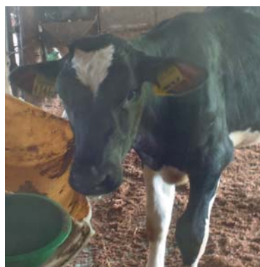
M牧場（那須塩原市）でのOPU処置