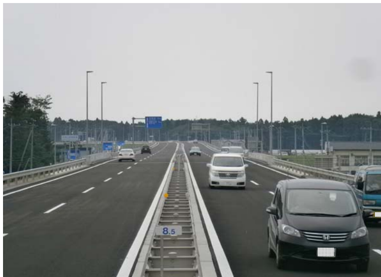
写真1: 完成供用区間の真岡宇都宮バイパス【国道121号交差部】