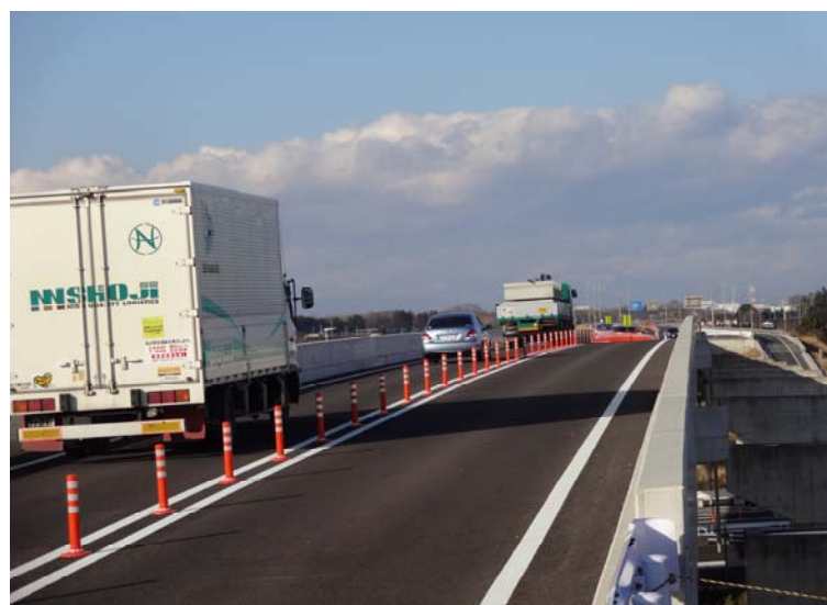
写真2: 暫定供用区間の真岡宇都宮バイパス【清南大地高架橋】