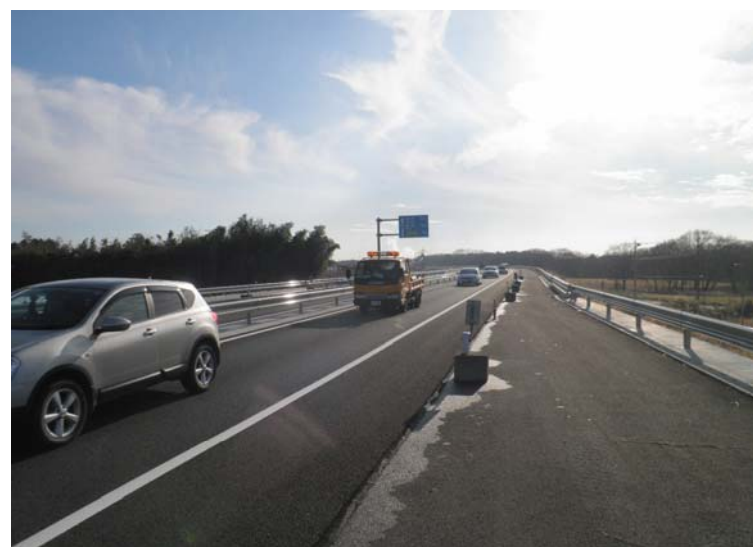
写真3: 暫定供用区間の真岡宇都宮バイパス【農業大学校付近】