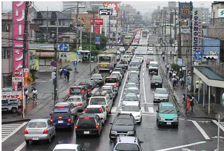
一の沢工区 整備後の護国神社前交差点付近供用状況