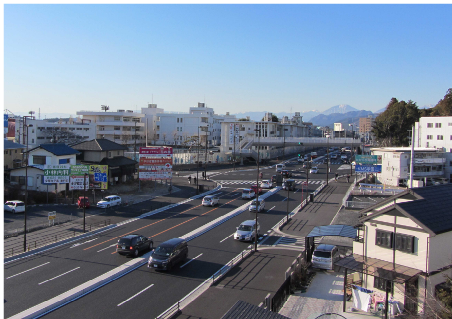
駒生工区・桜工区の整備前の通勤通学時間帯の交通状況