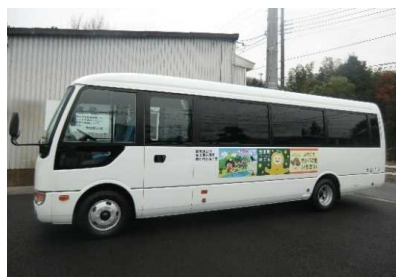
那須烏山市営バス市塙黒田烏山線