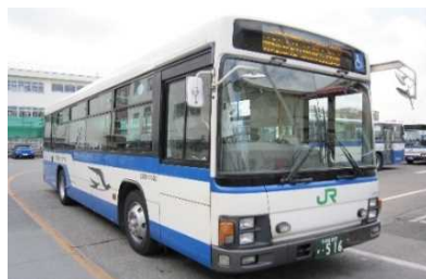
JRバス関東 水都西線