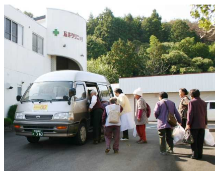
茂木町デマンド交通 めぐるくん

※ 市街地エリア 内のみご利用の場合、 大人(1回) 200円・小人(1回) 100円