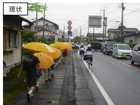
通学路の歩道整備 (壬生町大師町)

地域の安全・安心な暮らしを確保するため、事故が多く危険な箇所の改善対策を進めます。