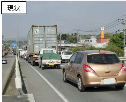
産業拠点とIC周辺の渋滞対策 (壬生町若草町工区)