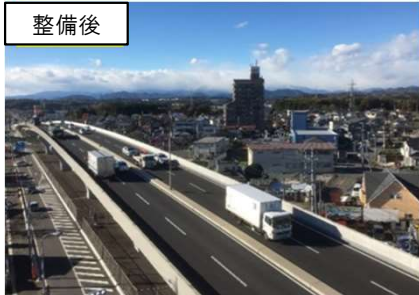
供用区間の状況（宇都宮環状北道路・下川俣陸橋）