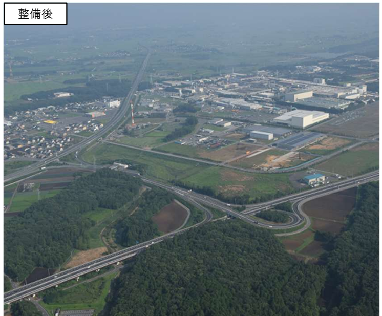
北関東自動車道真岡 I Cと国道408号沿線の工業団地群