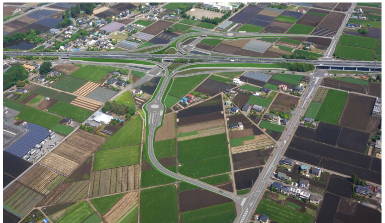
(仮称) 下野スマート I C の完成イメージ