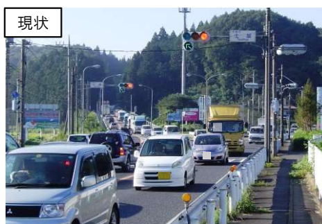
矢板市 土屋地区（矢板大田原バイパス）