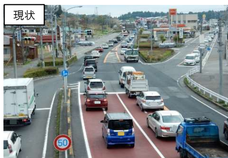
矢板市 中地区（矢板拡幅）