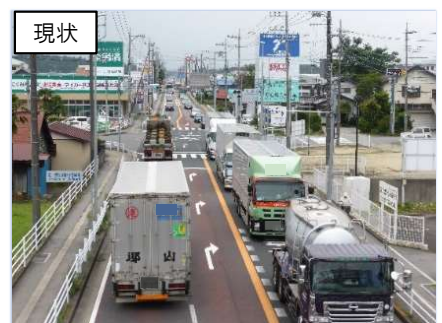
那須塩原市 三島地区（西那須野道路）