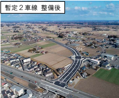
産業拠点と地域高規格道路を結ぶ道路整備 (宇都宮市平出板戸工区)