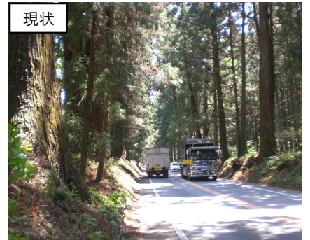
日光杉並木街道のバイパス整備 (日光市水無バイパス)