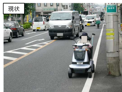
事故危険箇所の対策 (佐野市高砂町工区)