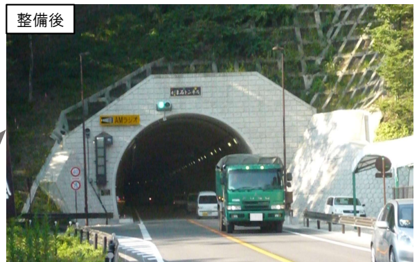
災害に強い幹線道路の整備 (那須塩原市下塩原バイパス・供用済区間)