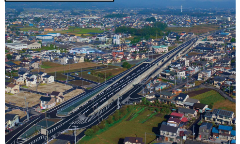
(都)小山栃木都賀線の供用区間の状況 (栃木市平柳町工区)