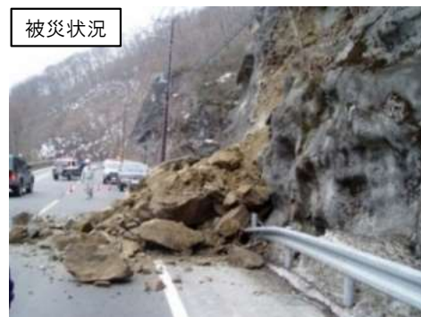
落石危険箇所の対策 (日光市五十里)