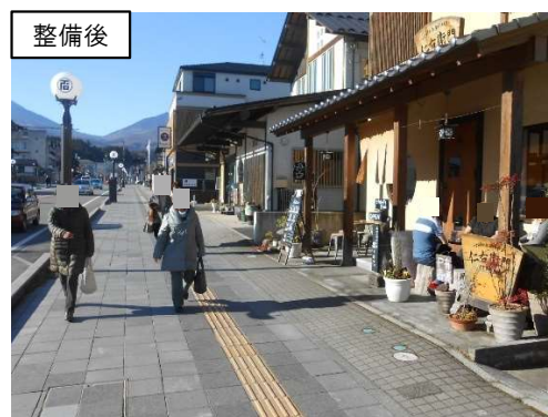
観光地の街並み景観整備 (日光市中心部の電線共同溝整備)