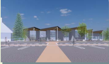
青木ふるさと物産センター完成予定図