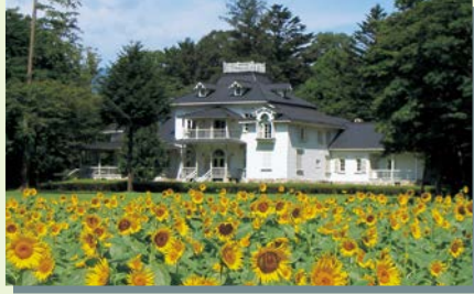
旧青木家那須別邸