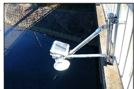
設置した危機管理型水位計