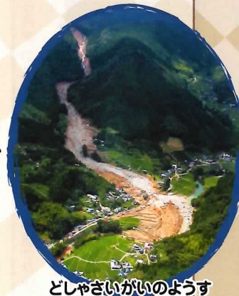
どしゃさいがいのようす

これまでの入賞作品は国土交通省砂防部Webサイトで見ることができます。 https://www.mlit.go.jp/mizukokudo/sabo/kaiga_sakubun.html