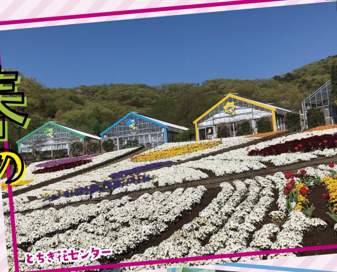
とちぎ花センター