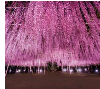
あしかが フラワーパーク