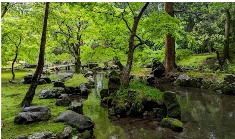
構成庭園例：北畠氏館跡庭園(三重県津市)