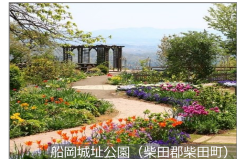
船岡城址公園 (柴田郡柴田町)