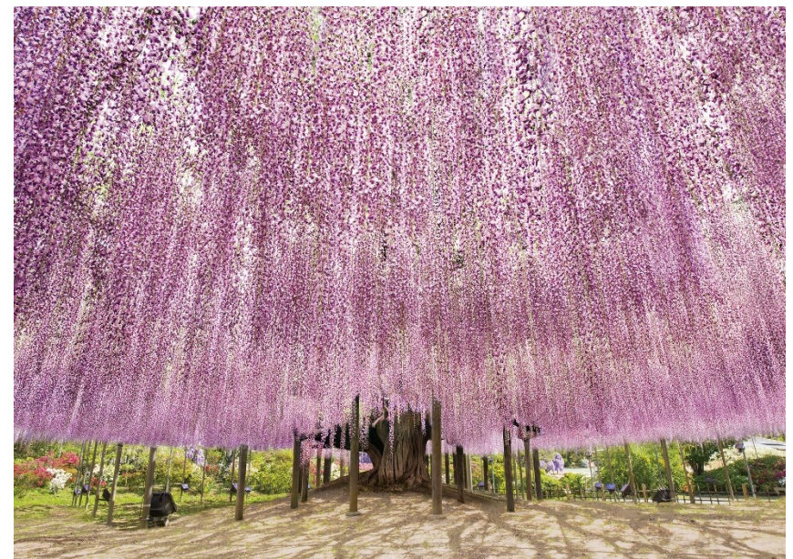
構成庭園例：あしかがフラワーパーク(栃木県足利市)