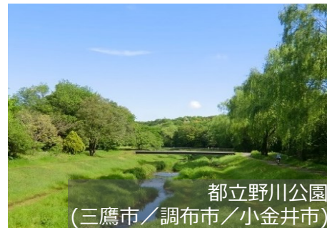
都立野川公園 (三鷹市/調布市/小金井市)