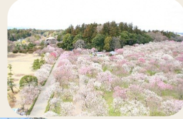
② 偕楽園公園 (茨城県水戸市)