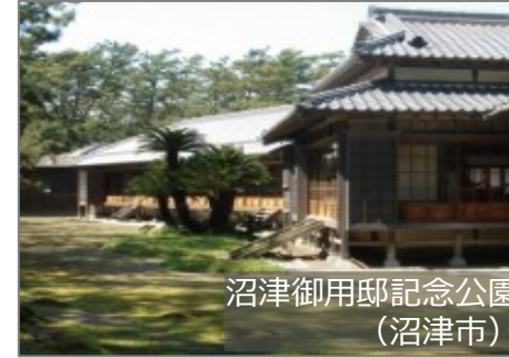
沼津御用邸記念公園 (沼津市)