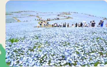
① 国営ひたち海浜公園 (茨城県ひたちなか市)