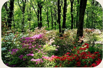
⑪ 赤城自然園 (群馬県渋川市)