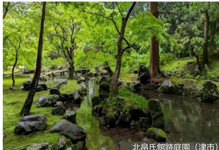
北畠氏館跡庭園（津市）