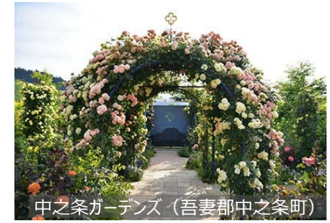
中之条ガーデンズ（吾妻郡中之条町）