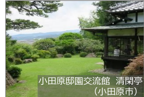
小田原邸園交流館 清閑亭 (小田原市)