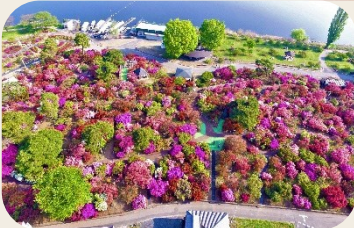
⑨ つつじが岡公園 (群馬県館林市)