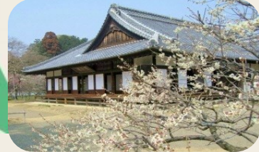
② 弘道館公園 (茨城県水戸市)