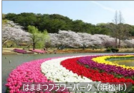
はままつフラワーパーク (浜松市)