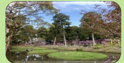
③伊奈富神社庭園(伊奈富神社)