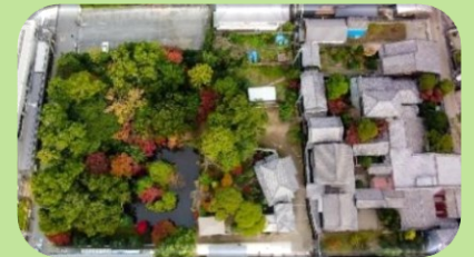
⑥旧長谷川治郎兵衛家 (特定非営利活動法人 松阪歴史文化舎)