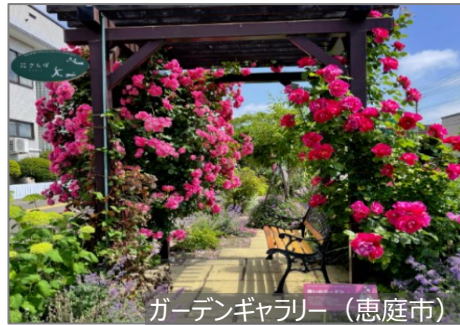
ガーデンギャラリー（恵庭市）