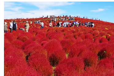
国営ひたち海浜公園