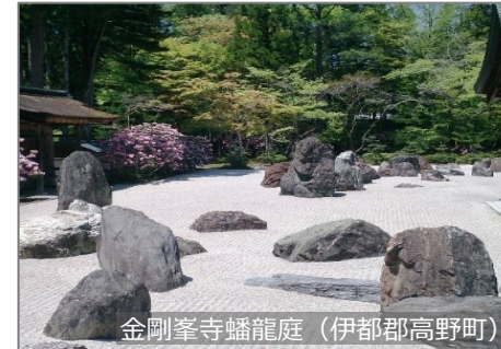
金剛峯寺蟠龍庭 (伊都郡高野町)