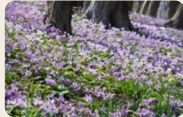
⑦ みかも山公園 (栃木県栃木市)