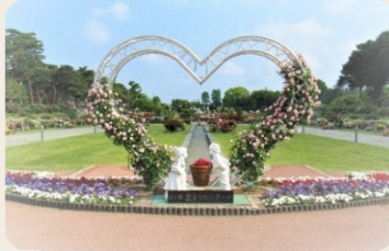
⑩ 敷島公園ばら園 (群馬県前橋市)