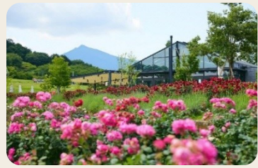
③ いばらきフラワーパーク (茨城県石岡市)