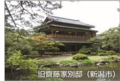
旧齋藤家別邸 (新潟市)