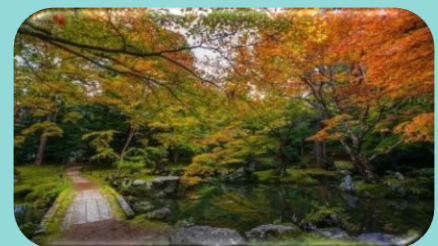
⑤北畠氏館跡庭園(北畠神社)