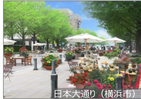
日本大通り (横浜市)