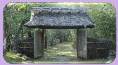
④真宗高田派本山専修寺 雲幽園 (真宗高田派本山専修寺)