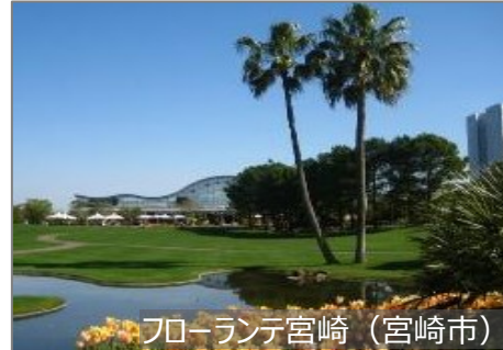
フローランテ宮崎 (宮崎市)