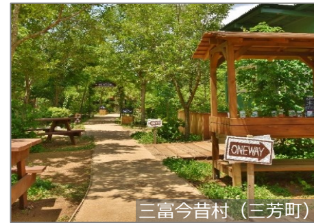
三富今昔村（三芳町）