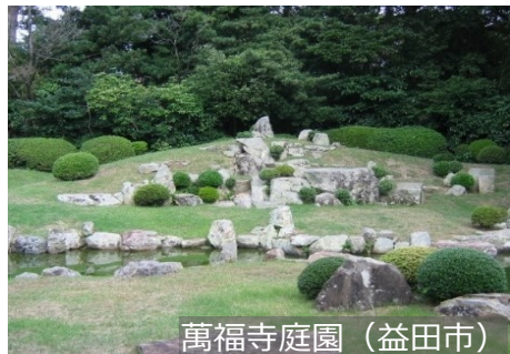
萬福寺庭園 (益田市)