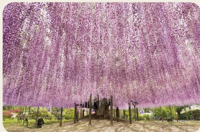
⑧ あしかがフラワーパーク (栃木県足利市)