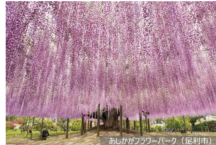
あしかがフラワーパーク（足利市）