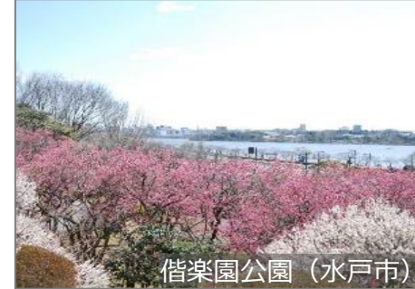
偕楽園公園 (水戸市)