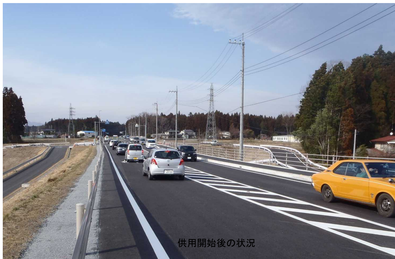
供用開始後の状況