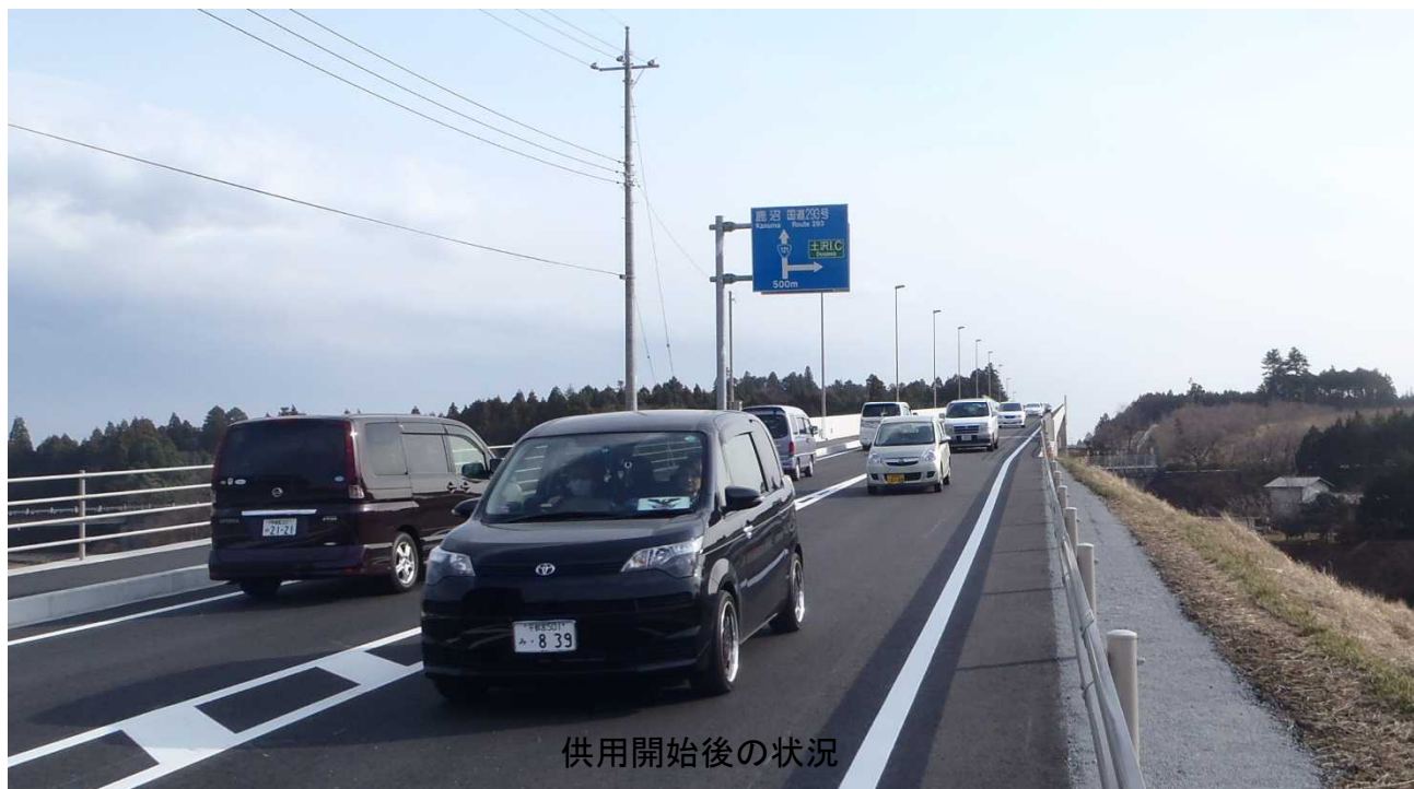
供用開始後の状況