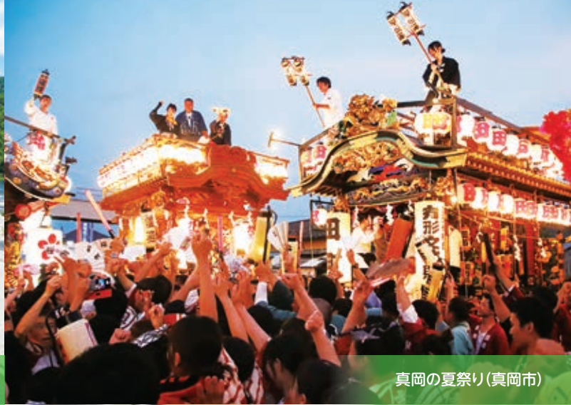
真岡の夏祭り(真岡市)