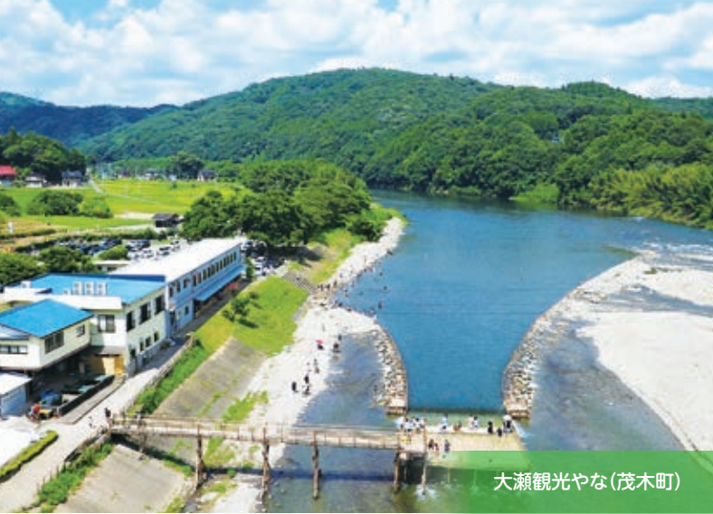
大瀬観光やな(茂木町)