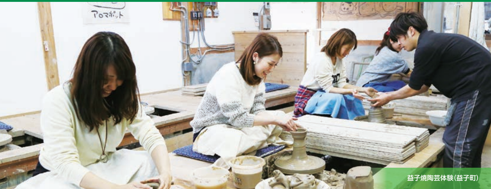
益子焼陶芸体験(益子町)