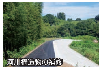
河川構造物の補修