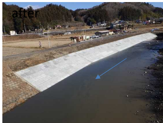
一級河川 武茂川 那珂川町 健武 新太郎橋上1