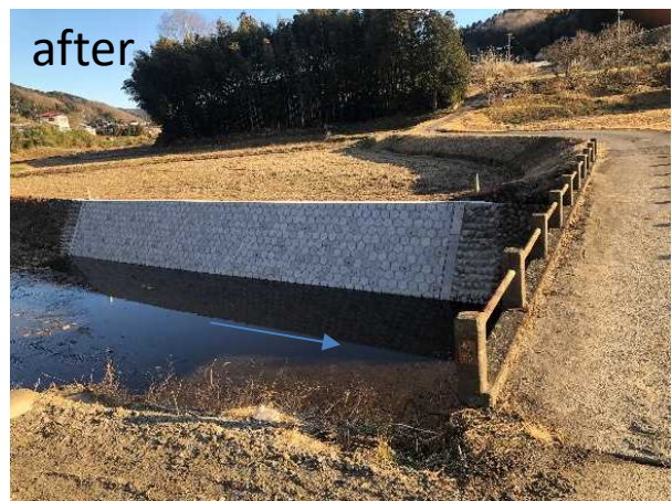
矢又川 那珂川町 矢又 静橋上