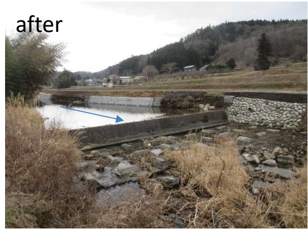
一級河川 大内川 那珂川町 大内 滝沢橋下