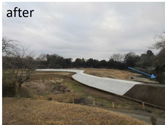
一級河川 荒川(塩谷) 那須烏山市 大里 JR橋上