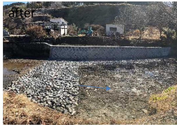
一級河川 富山川 那珂川町 富山 稲荷神社上