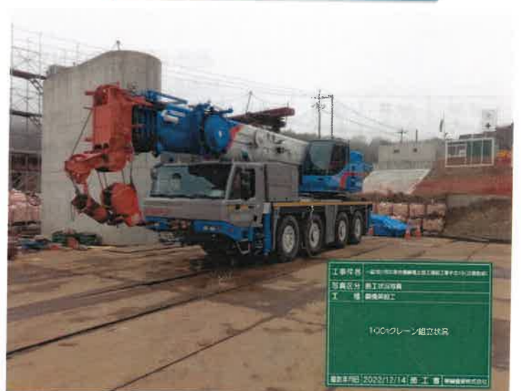
6. 大型クレーン組立