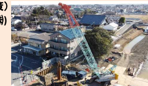
橋台・橋脚の基礎となる、場所打杭の施工をしています。撮影日R4.2