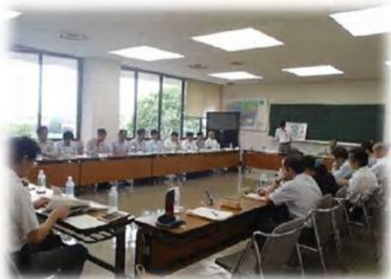
平成25年度鬼怒工業用水協議会

今後とも鬼怒工業用水協議会などを通じて需要者の皆さまとの意思疎通を図りたく思いますので、ご協力のほどよろしくお願いいたします。