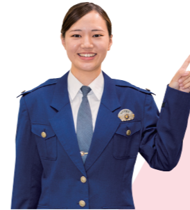
警務部 県民広報相談課 平成30年採用