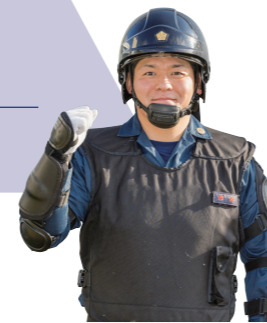
警備部 機動隊 平成27年 採用

治安を守る部隊として活動する機動隊員は、体力錬成はもちろんのこと、非常事態に対処するための知識・技能が求められます。栃木県警察最後の砦として、強靱な体力、諦めない精神力を鍛えて、日頃の業務にあたっています。目標を持ち、県民の期待に応える警察官を目指してください。