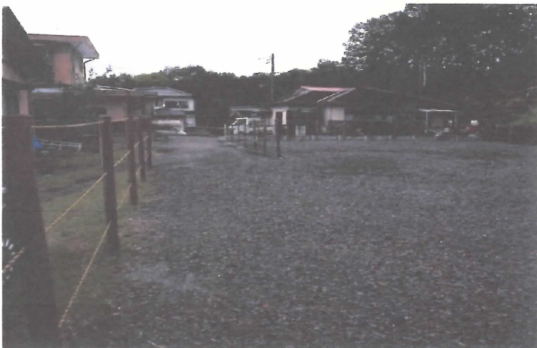
対象物件の南西側から北方を見て撮影