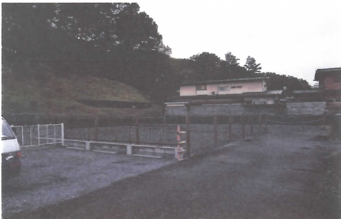
対象物件の西側接面道路北から撮影