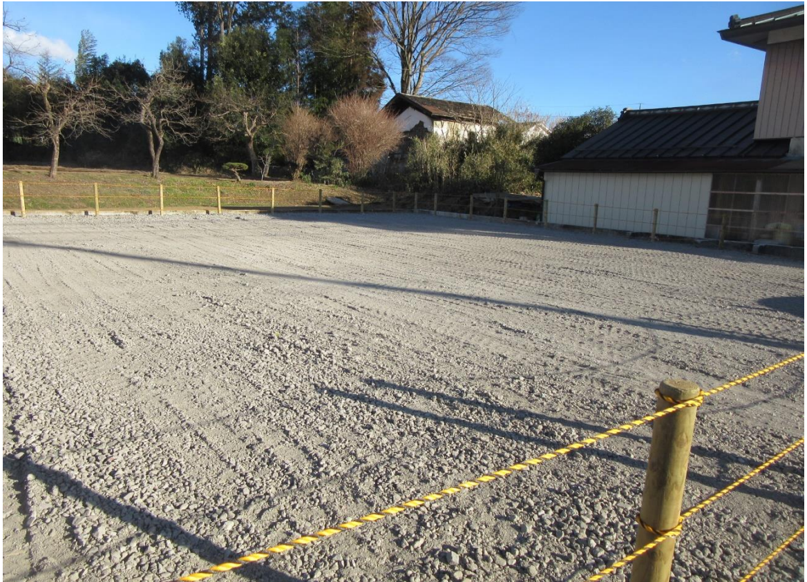
対象物件の北西側から南東方を見て撮影