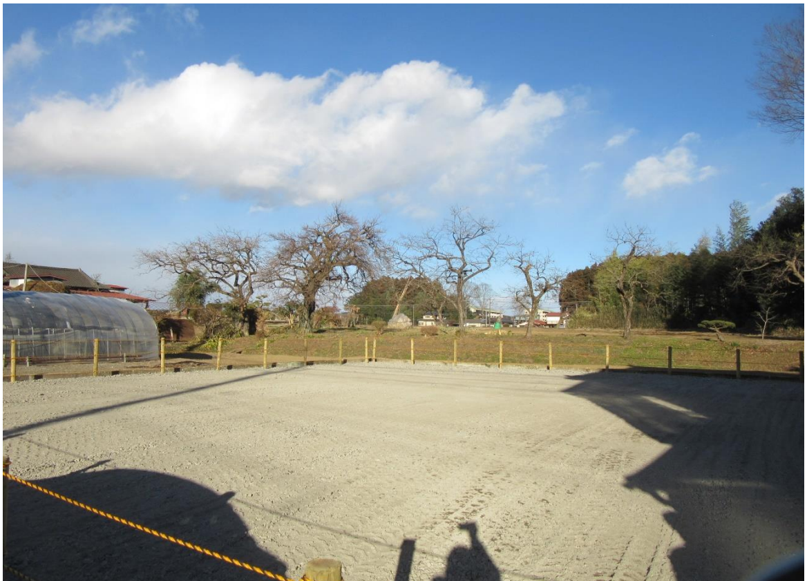
対象物件の南西側から北東方を見て撮影