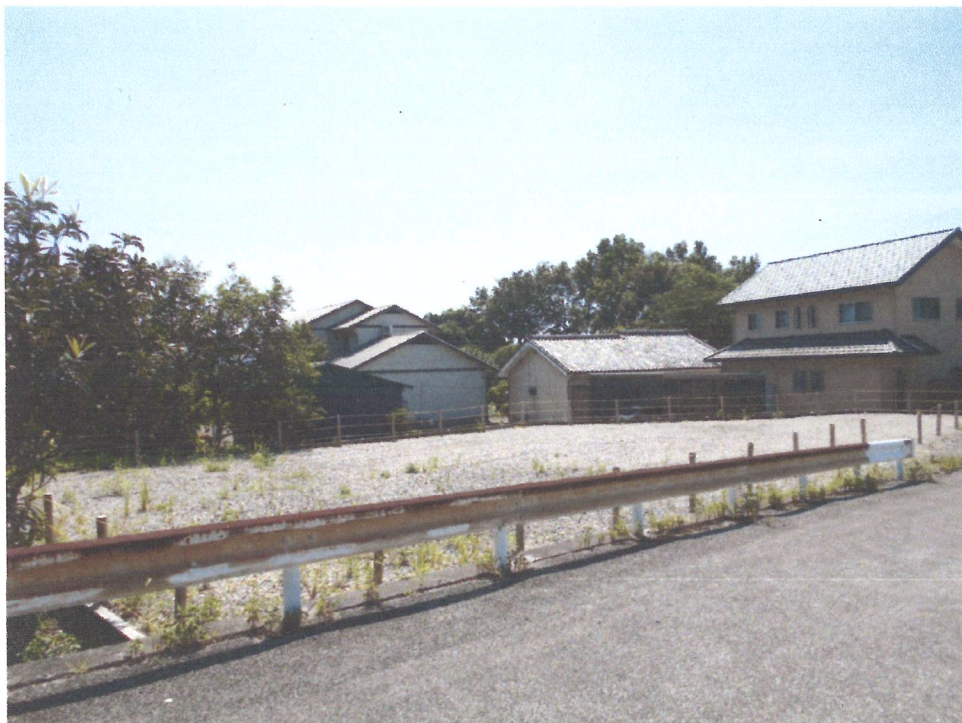
対象物件の北西側から南東方を見て撮影