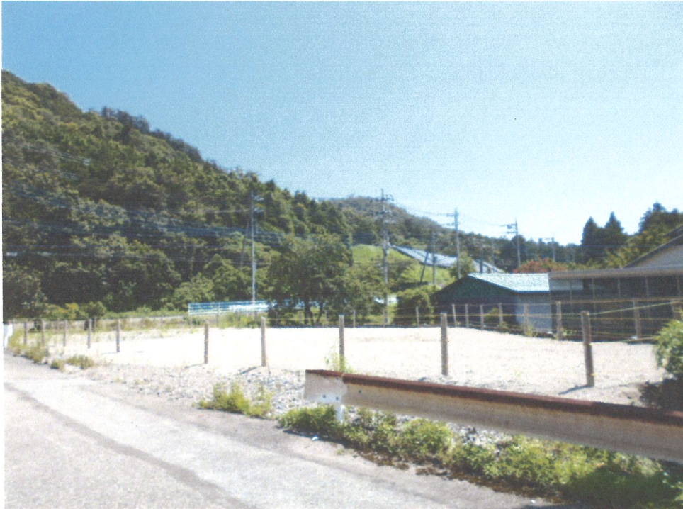
対象物件の南西側から北東方を見て撮影