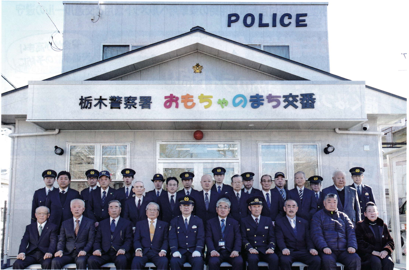
令和6年1月30日、改築したおもちゃのまち交番の開所式を開催しました。

発行・栃木警察署 ☎0282-25-0110(代)・栃木地区交通安全協会・栃木地区防犯協会