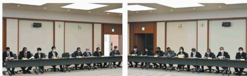
▲ 正副委員長・会長会議の様子(4月12日) ▲