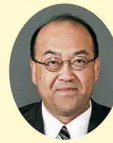
山口 恒夫 (公明党)※