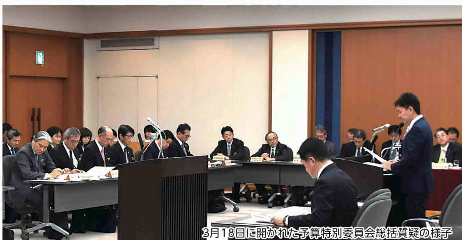
3月18日に開かれた予算特別委員会総括質疑の様子

臨時財政対策債は、国から地方公共団体に配分する地方交付税が足りないため、その不足する金額の一部を、いったん地方公共団体で借り入れをしてまかなう県債のことです。なお、返済する際の財源は、全額、地方交付税で補てんすることとされています。