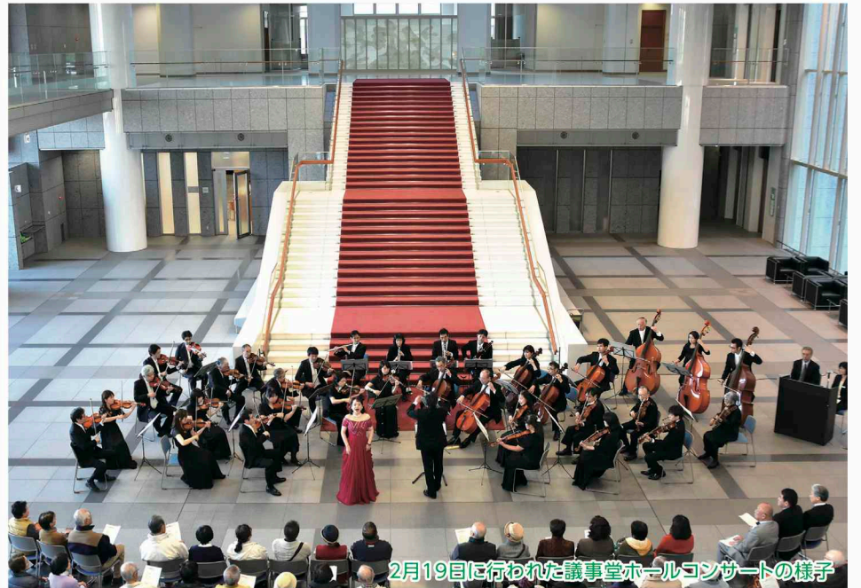
2月19日に行われた議事堂ホールコンサートの様子