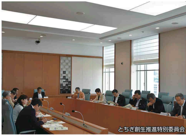
とちぎ創生推進特別委員会

栃木県版まち・ひと・しごと創生総合戦略「とちぎ創生15(いちご)戦略」に基づく取組が、より実効性のあるものとして推進されるよう、県内の実情、課題、推進方策等について幅広く調査研究を進めるため、「とちぎ創生推進特別委員会」を3月24日に設置しました。 人口減少は時代の趨勢であり、劇的な変化は見込めないことから、今後は、これまでの右肩上がりの時代から発想を変えていく必要があります。このような考えのもと、人口減少や人口構造の変化に対応した社会システムへの転換を進める「人口減少社会適応戦略」を中心に、その具体策及び効果的な推進方策について調査研究を行い、提言をとりまとめ参ります。