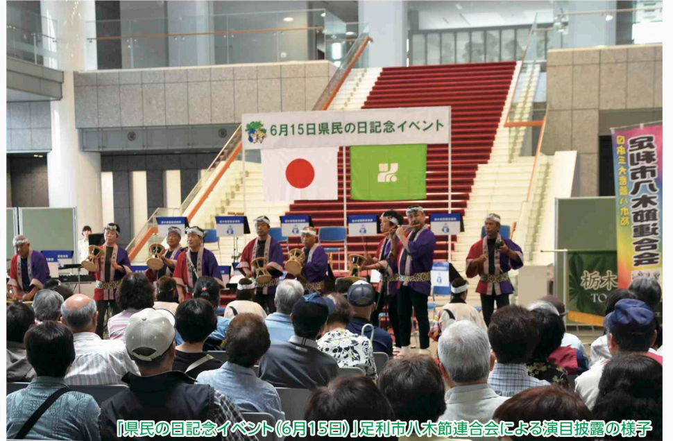
「県民の日記念イベント(6月15日)」足利市八木節連合会による演目披露の様子