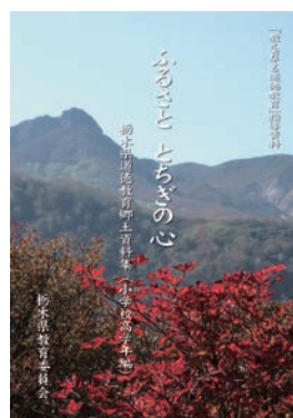
ふるさととちぎの心 (栃木県道徳教育郷土資料集) 【小学校高学年編(平成27年3月)】