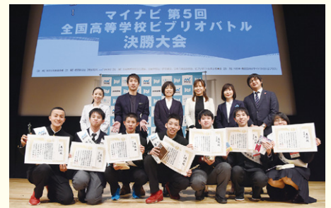
▲今年1月の決勝大会表彰式の様子