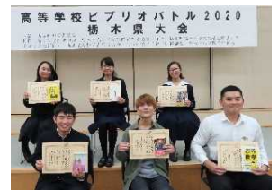
高等学校ビブリオバトル2020 栃木県大会 優勝・入賞者

【後援】 活字文化推進会議、読売新聞社、栃木県学校図書館協議会、栃木県読書推進運動協議会、 栃木県公共図書館協会