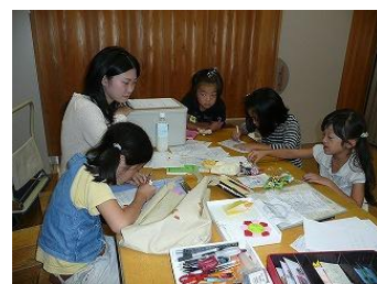
自由に活動中。 室内ではブロックやアイロンビーズ作りなど。