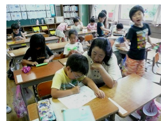
自由に活動中。 宿題をやっている子もいます。