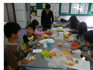
理科実験で、みかんを使った 年賀状づくり。