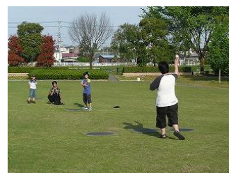
屋外ではボール遊びなど。夏は近くの小川でザリガニとりなども体験しています。