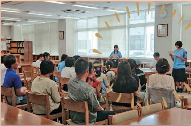
実際の様子。お客さんも来てくれて、盛況！

文化祭の一般公開で、「ロミオとジュリエット」第一幕の朗読劇を上演しました。「カオス」をテーマに、男子がジュリエットを、女子がロミオを演じ、それぞれ堂々と役をこなしました。