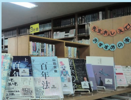
先生おしえて！ おすすめの本