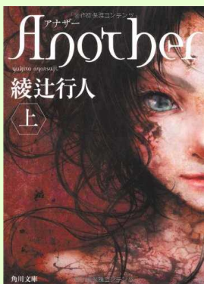
『Another』上・下 (綾辻行人／著 KADOKAWA) 角川文庫

ミステリー好きには、絶対読んでほしい本！！ 中学の時に初めて読んで、心に残りました。綾辻さんは表現が本当にリアルで、少しゾッとするけど、不思議な世界に引き込まれます