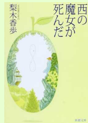
『西の魔女が死んだ』 (梨木香歩／著 新潮社) 新潮文庫

学校での生活に嫌気がさし、不登校になってしまった中学生・まいが、祖母の元での魔女修行により精神的に成長していく、心温まる物語です。生きる力を与えてくれる祖母の言葉や、登場人物の「死」の捉え方が印象的で、私は今もその言葉に支えられています。精神的な葛藤の中を生きる中学生の皆さんにこそ、読んでほしい一冊です。