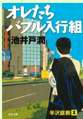
「半沢直樹シリーズ」 〔『オレたちバブル入行組』 (池井戸潤／著 文藝春秋) 文春文庫〕

半沢直樹シリーズは、テレビドラマ化されて話題を呼んでいましたが、ぜひ本も読んでいただきたいです！