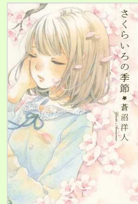
『さくらいろの季節』 (蒼沼洋人／著 ポプラ社)

どこの学校でも起こりそうなことから発展した、いじめや人間関係について描かれています。描写がかなり生々しいので、実際に目の前でこんなことが起こったら…と考えさせられました。