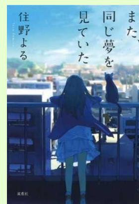
『また、同じ夢を見ていた』 (住野よる／著 双葉社) 双葉文庫

ミステリー好きには、絶対読んでほしい本！！ 中学の時に初めて読んで、心に残りました。綾辻さんは表現が本当にリアルで、少しゾッとするけど、不思議な世界に引き込まれます