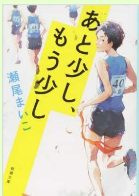
『あと少し、もう少し』 (瀬尾まいこ／著 新潮社) 新潮文庫

中学の時に出会った本。中学生6人が駅伝大会のためにチームを組み、県大会出場を目指す青春小説です。6人それぞれの視点から描かれるこの物語は、駅伝を通してたくさんのことを教えてくれます。仲間との関係に悩み、やがて心をつないで、一つのことを成し遂げる素晴らしさを知る彼らの姿に、共感できるところも多いと思います。読むと力がわいてきて、自分も頑張ろうと思える作品です。