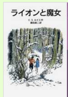
『ナルニア国物語 ライオンと魔女』 (C.S.ルイス／作、瀬田貞二／訳 岩波書店) 岩波少年文庫

魔法が存在するナルニア国で、四人のきょうだいが仲間と協力して様々な試練に立ち向かい、成長していく物語です。エドマンズの裏切り、アスランの死と、次はどうなってしまうか、予想のつかない展開がポイントです！