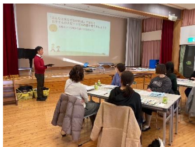
日吉保育園保護者研修会

昨年度までの講演が中心だった研修から、いよいよ講話とワークショップを織り交ぜた、参加者主体の学習会が戻ってきました。