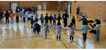
大室小人権週間職員研修