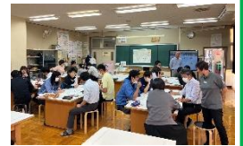
既存の活動の見直し

“私の推し”紹介でアイスブレイクしたあと、大沢中の育成を目指す資質・能力である「ともに学び合う力」に向かう内容であったかという視点で見直し、ブラッシュアップしました。次の活動が楽しみになりました。