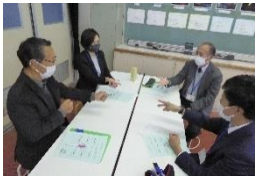
シウマイじゃんけん