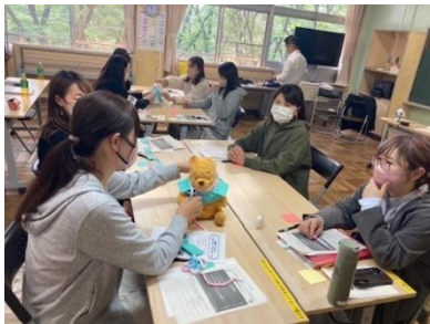
さつきが丘小家庭教育学級