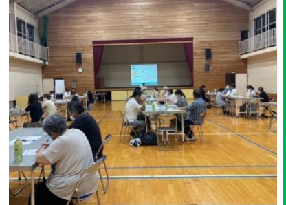
青少年育成市民会議保護者研修会(東部台コミセン)

また、青少年健全育成に関するサポートでは、「考えてみよう インターネットとスマホの光と影」のテーマで、SNSの現状を知り、安全に付き合うための使い方3箇条を考えました。