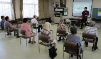
生きがいのつどい

コロナ禍が過ぎ、日常が戻ってきました。この間に「LGBTQ」「コロナ差別」「SNSを使った偏見・差別」といった新たな人権問題が、広く認識されるようになりました。