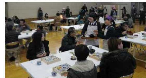
【おもてなしの心で接する生徒】