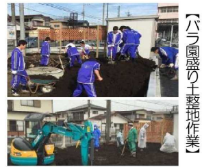
【バラ園盛り土整地作業】