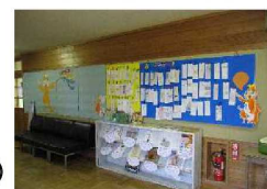
▲図書室廊下が大変身