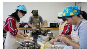
【地域の人と共に和食を学ぶ】

手入れに来てくれた地域の人が一休みできるように、一部に芝を張り、テーブルと椅子も置く予定でいる。地域の人と生徒とのふれあいが楽しみである。