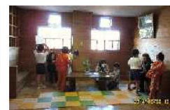
▲心強いかけ算ボランティア