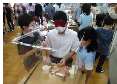
【目の見えない方へおもてなし体験】

安良沢小学校では、3者の連携により、「思いやり」をテーマとして、福祉体験を実施しました。2～3年生は目の見えない方へのおもてなし体験、4～5年生は視力が弱く歩行が不安定な方への校内移動のサポート体験をしました。障害をもつ方へ、自分の思いを伝えることの大切さ