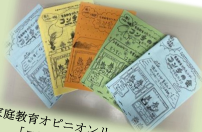
家庭教育オピニオンリーダー喜連川支部「コンチの会」季節のおたより コロナ禍の中でも、親子で楽しくできる体験を手作りのお便りで提供しています。