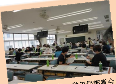
矢板東高附属中第1学年保護者会「家庭教育支援プログラム思春期版」でのワークショップを実施しました！

これまでも各市町の家庭教育支援や子育て支援では、その参加者、目的などに応じて、さまざまな形の研修や講座が行われてきました。今年度はさらに「オンライン」を使った研修や講座が取り入れられています！