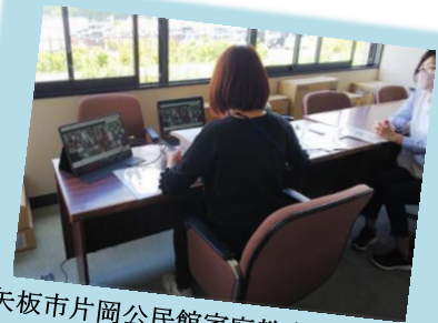
矢板市片岡公民館家庭教育学級「ちびにこ」 昨年度からオンラインを取り入れて開催しています！

6月には、ふれあい学習課でも各市町家庭教育支援者の協力を得ながら「子育てオンライン座談会」を開催しました！各市町でも工夫をしながら、支援や学びを進めている様子が見えがえします！