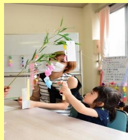
那須烏山市家庭教育オピニオンリーダー支部会主催「ひまわりきっず」 様々な親子のふれあい活動を実施しています！