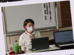
塩谷町立大宮小学校 PTA 家庭教育講演会 リモート形式で聴講しました！