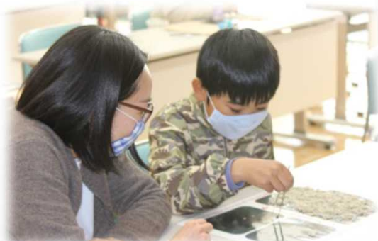
チリメンモンスター探し(那須烏山市)