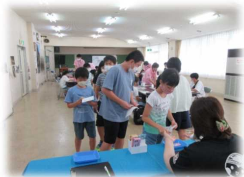
おこづかいゲーム(塩谷町)