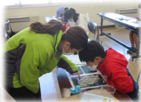
チリメンモンスター探し(さくら市)