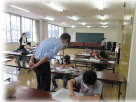
まが玉をつくろう(さくら市)