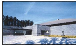
那須野が原博物館

※関連イベントがあります(要申込)。詳細は、ホームページを御覧いただくか、お電話でお問合せください。