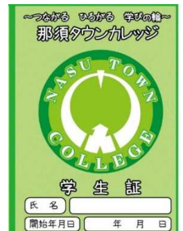
タウンカレッジ 学生証

○講座等を受講した際、1ポイントを付与します。(写真右：学生証にスタンプする)スタンプを30個集めると学生証の色が緑→青→黄→ピンクとランクアップします。ポイントをすべて集めてピンクが終了すると修了証書を授与します。